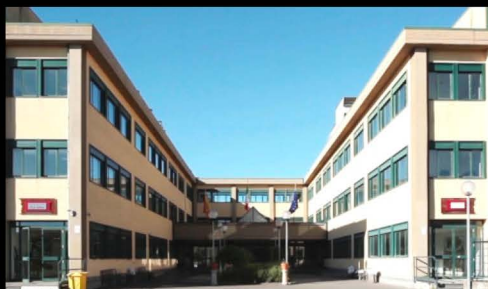
Nuova sede, ingresso principale, Catania