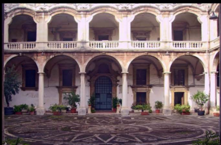
Vecchia sede, Cortile del Collegio dei Gesuiti, Catania

L'intitolazione a Mimi Lazzaro, noto scultore catanese del novecento, nasce dal fatto che fu il primo direttore dell'Istituto d'Arte. Il nostro liceo si sviluppa sul solco della tradizione del "fare", ma con una didattica aggiornata, incentrata sull'educazione al percorso progettuale, che coniuga formazione culturale, creatività funzionalità del prodotto; tutto ciò aperto al mondo del digitale, della tecnologia e dell'aggiornamento Know-How. Dopo un biennio comune con tre ore settimanali di laboratorio artistico e dieci ore di discipline di indirizzo come grafico-pittoriche, geometriche, plastico-scoltoree, gli studenti sono convocati a scegliere un indirizzo di studi tra i sei attivati dal MIUR. Oggi il Liceo Artistico Statale M.M. Lazzaro è ubicato in una struttura innovativa con ampie aule studio e spazi laboratoriali attrezzati sia per la produzione manuale che quella digitale, con attrezzature all'avanguardia.